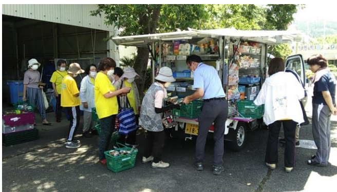
大分県由布市での移動販売の様子

イオン九州は、移動販売サービスにより、必要な食料品や日用品を手にとってお買物ができる“安心感”とお買物の“楽しさ”をご提供いたします。また地域のみなさまの外出機会を増やし、お客さま同士や巡回を担当するイオン島原店の従業員とのコミュニケーションの場づくりの役割を担い『これからもずっと住み続けたいまちづくり』に貢献してまいります。