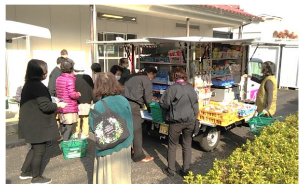
長崎県長崎市での移動販売の様子