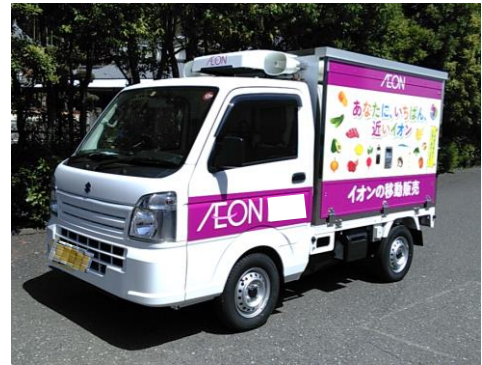
イオンの移動販売車

島原市での移動販売は、月曜日・火曜日・水曜日・金曜日にお肉・お魚などの生鮮品やお寿司・揚げ物などのお惣菜を含む食料品に加え、トイレットペーパーや洗剤をはじめとした日用雑貨など、日々の暮らしに必要な約400品目をイオン島原店（長崎県島原市）から移動販売車に載せて、各拠点を巡回し販売いたします。